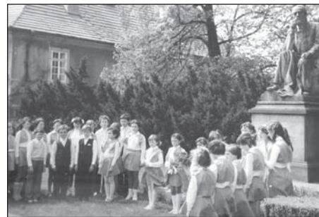
Pokládání květin v Roce české hudby 1984