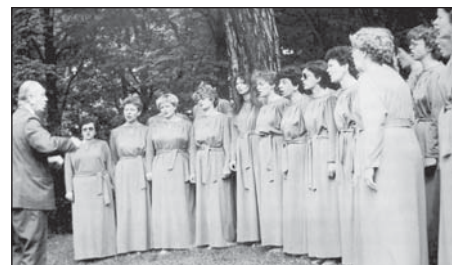
Foto: Ženský pěvecký sbor, Smet. dny 1986.