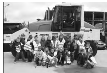
Žáci 2. B, ZŠ Malecí

py, a jak barevné jsou válce, které putují lodí přes oceán až do Ameriky. Nakonec jsme si mohli vyzkoušet, jak se v takovém silničním stroji sedí.