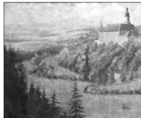
Novoměstský zámek, olej