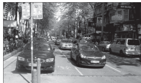
Mariahilfer strasse v centru Vídně, cyklopruhu pro cyklisty