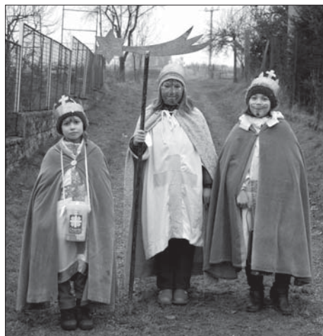
Foto: tříkráloví koledníci ve Vrchovinách