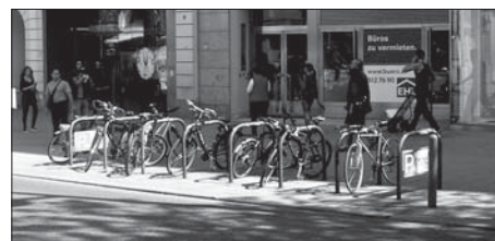
Mariahilfer strasse - stojany na kola