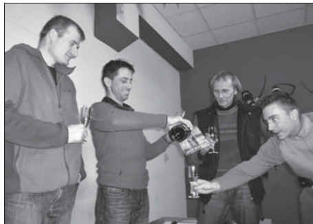
Autoři lezeckých průvodců tří regionálních oblastí.

Historická část obsahuje pohled do padesátileté éry novoměstských lezců a horolezců. Najdete zde jak stručný pohled do činnosti v jednotlivých historických obdobích, tak i další kapitoly s konkrétními tématy. Nechybí popis a způsob samovýroby horolezeckého vybavení v 70.-80. le