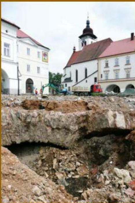
Pohled na část klenby studny při jejím objevení.