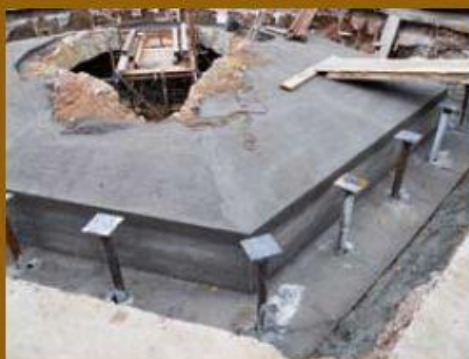
Betonáž pod nosnou konstrukcí.