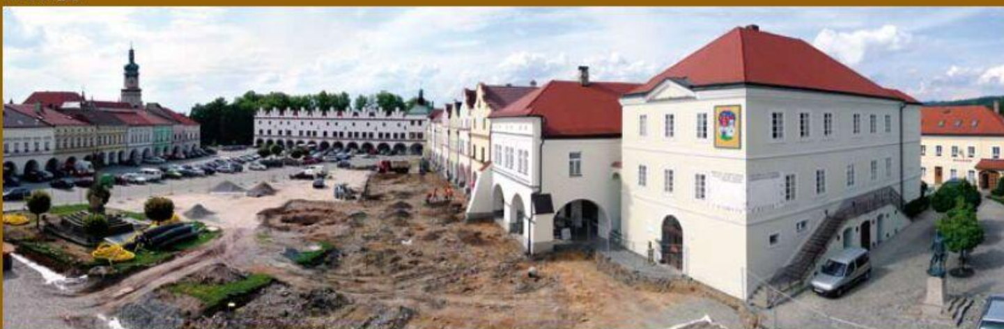
Panoramatický snímek zachycuje jednu z etap rekonstrukce Husova náměstí, při které byla historická studna objevena.