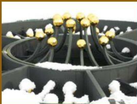
Detail ozdobné ochranné mříže.