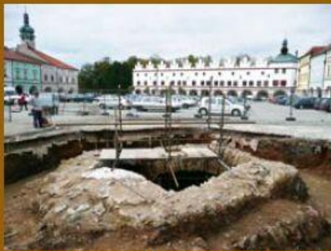
Po pokrytí klenby se objevilo další vnější opláštění.