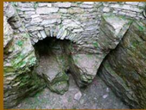
Pohled do nitra studny.