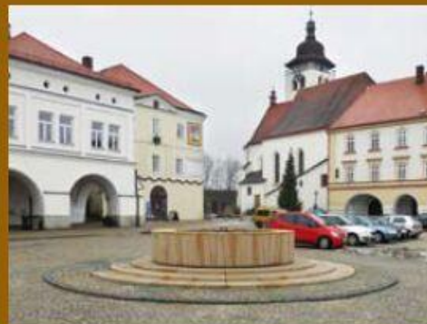
Celkový pohled na „novodobou“ studnu.