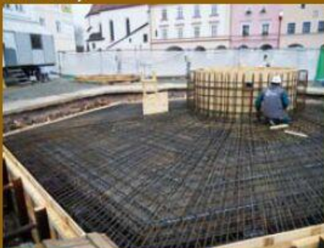
Příprava ocelové konstrukce pro následné betonování.