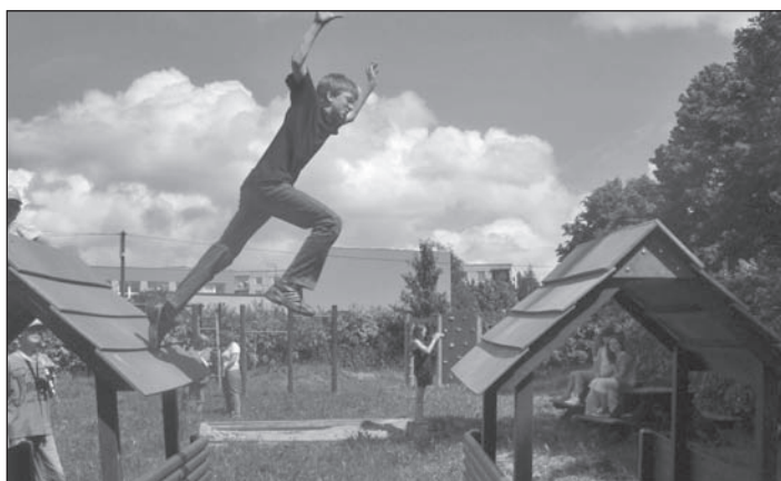
Skok do nebes