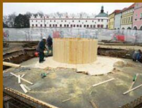
Montáž bednění pro ocelovou konstrukci.