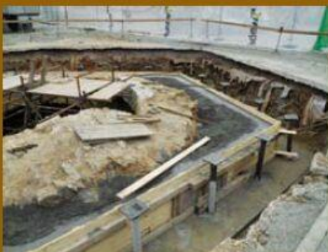
Vybudování nosných pilotů a zpevnění vnějšího zdiva studny.