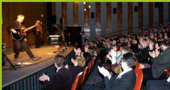
Pohled do zaplněného sálu Kina 70.