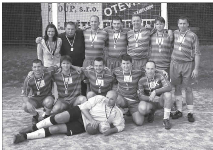
Vrcholový sport – kolektivy. Sokol Krčín – muži A – národní házená.