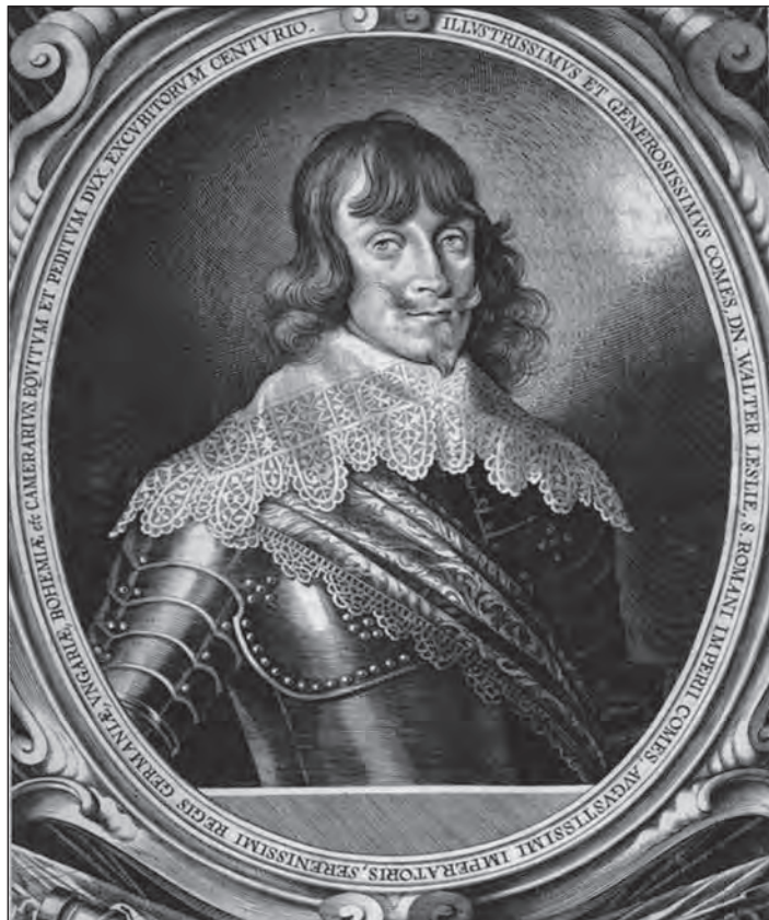
Walter, hrabě z Leslie, polní maršál a viceprezident dvorské válečné rady, jeden z majitelů novoměstského panství.

Seznamme se postupně s historickými událostmi, ke kterým během pěti set deseti let trvající existence Nového Města nad Metují došlo také v „roce jedna“, a to nejen v našem městě, ale i v naší zemi, a které ovlivnily nebo mohly ovlivnit životy našich předků.