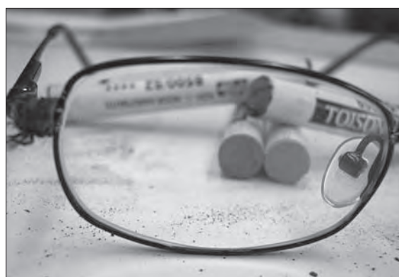
Jeden z vítězných snímků.

Gratulujeme a přejeeme další úspěšné snímky!