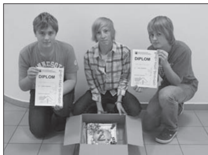
V. Vit, ZŠ a MŠ Krčín

A to nejlepší nakonec. V soutěži se rozdávalo sedm cen a naši žáci si domů dovezli čtyři ceny. Naše škola byla vyhlášena jako nejuspěšnější z celého okresu.