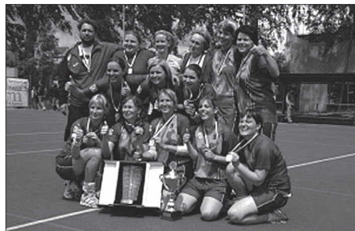
Fotografie krčínských žen, které v ročníku 2010 – 2011 získaly titul Mistra ČR.