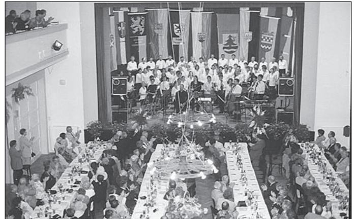
Setkání členů sdružení „Nová Města v Evropě“.