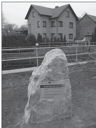
Pamětní deska v kameni – nad kruhovým objezdem ve Vrchovinách.