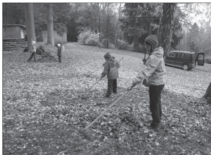
Skautky pečují o svatou Barboru.