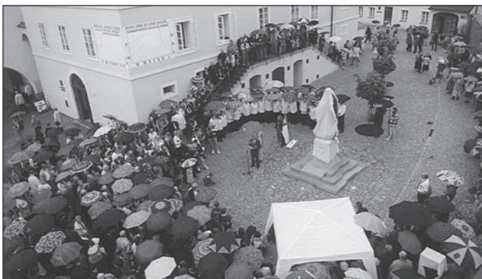
Odhalení sochy zakladatele města – Jana Černčického z Kácova.