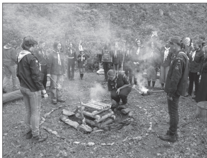
Dívčí skautování nejen na řece Metuji.

V prvních listopadových dnech letošního roku zorganizoval 2. oddíl vodních skautek „Vydry“ úklidovou brigádu u kostela sv. Barbory na Rezku. Této již tradiční dobročinné akce novoměstských skautek se zúčastnilo 12 děvčat, která se zapálením sobě vlastním jako každoročně shrabala listí a očistila schody ke kostelu, zarostlé mechem. Po několika hodinách usilovné práce je „Barborka“ i poklizené okolí připraveno na zimu.