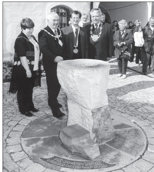
Pítko v Hildenském atriu.