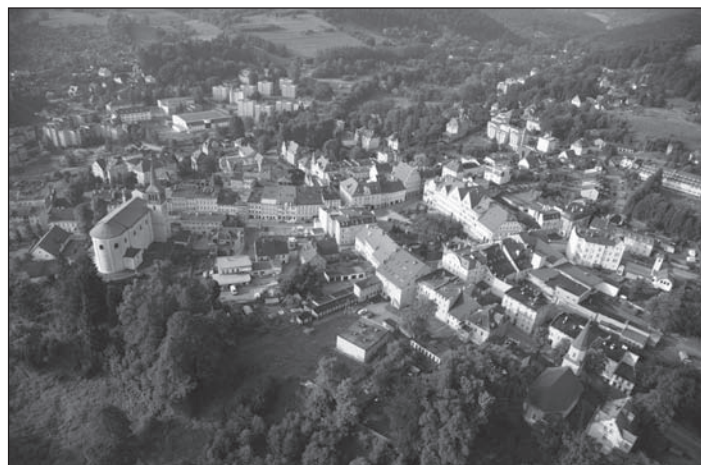
Letecký pohled na město.

Až do poloviny 16. století mluvili obyvatelé homolského panství česky. Slovanský původ má i název města Duszniki. Někteří jazykovědci jej odvozují ze slova „dušnost“, „dušné klima“, neboť již v dávných dobách zde vyvěral léčivý pramen bohatý na kyslíčnick uhlíčitý.