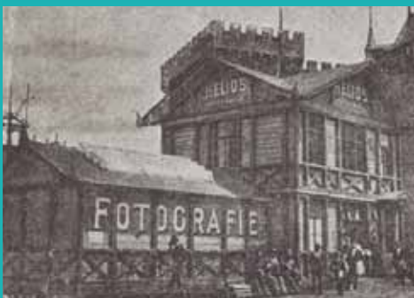
↑ Pavilon družstva Helios z průvodce Zemskou jubilejní výstavou, 1891.