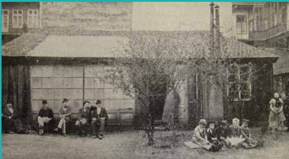
↑ První ateliér ve dvoře domu č. 8 v Bartolomějské ulici (1889 – 1897).