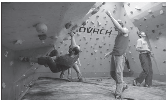
Součástí otevření byly i veřejné boulderingové závody, kterých se zúčastnilo na třicet lezců.

Velice děkujeme našim štědrým sponzorům: