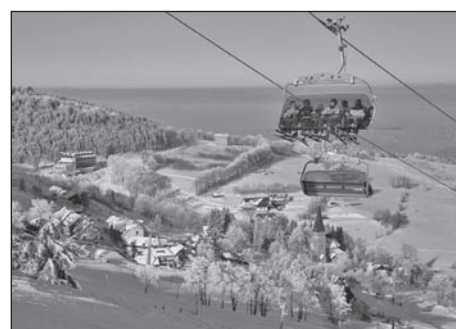
Pohled na Zieloniec – středisko zimních sportů.