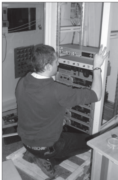
Podstavec s úložným prostorem (rack).

Ve dnech 3. – 10. ledna 2012 došlo v Kině 70 k instalaci digitální technologie standardu DCI.