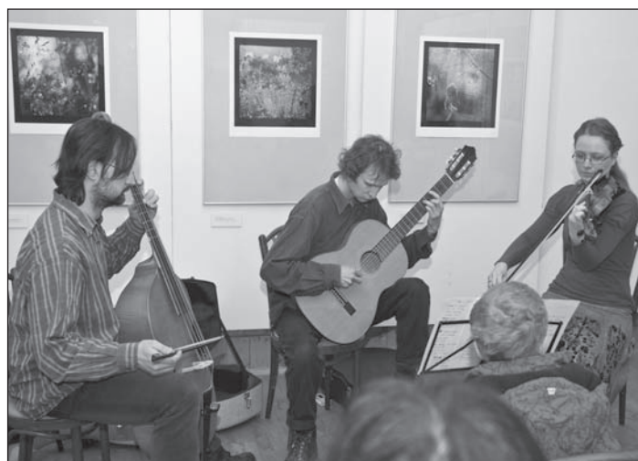
Záběr z vernisáže výstavy – vystoupení souboru La Bilancetta.