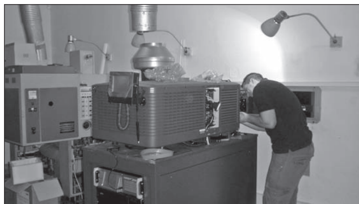
Digitální projektor DCI typ Christie Solaria CP2220 4K READY (pro použití ve středních kinech).