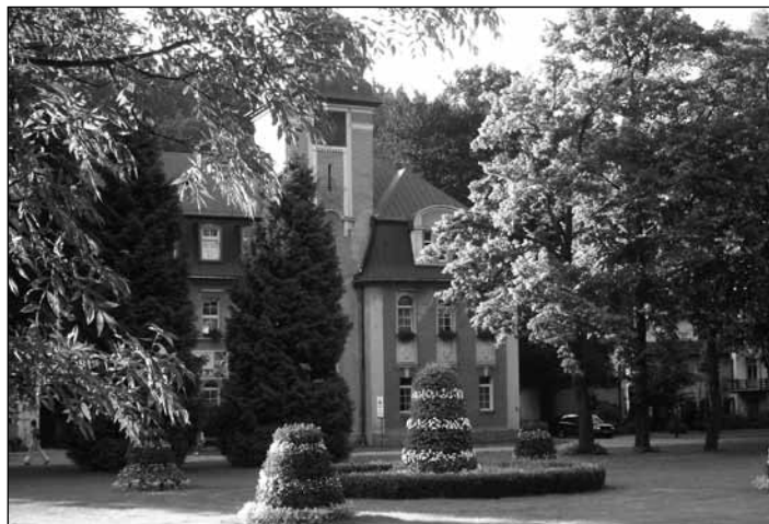
Pohled na lázeňský dům Jan Kazimierz (Jan Kazimír), pojmenovaný po polském králi, který v roce 1669 v Dusznikach Zdroju nocoval.

Jak jsme vám naznačili již v minulém čísle Novoměstského zpravodaje Bad Reinerz (lázně Duszniki Zdrój) byly ve své době velice slavné a zdejší lázeňské služby vyhledávala i řada „korunovaných hlav“, významných politiků, hudebníků, či básníků.