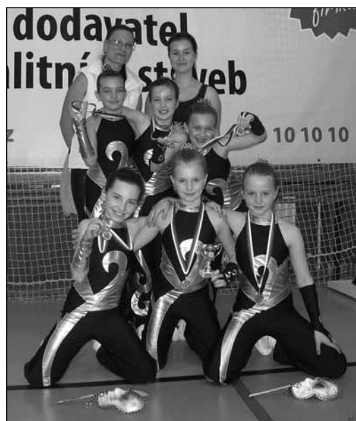
Tým Fitness 2 a jejich oceněné „Oživlé sochy“.