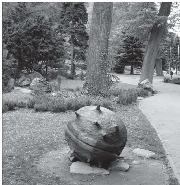
Dřevěný kaštan v lázeňském parku.

Výsledkem všeho bylo, že Jan Kazimír roku 1668 dobrovolně abdikoval a rozhodl se odjet do Francie, kde se stal opatem (Francii miloval i přesto, že zde v mládí byl vězněn kardinálem Richelieu).