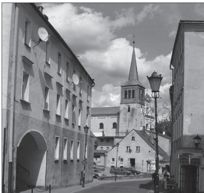
Pohled na kostel sv. Petra a Pavla.