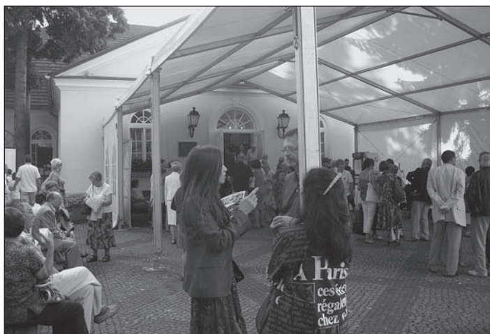
Pohled na Dworek Chopina v době konání festivalu.