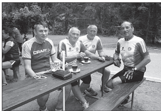
Záběr z cyklistického výjezdu členů novoměstského KČT – cíl Vrchmezí.