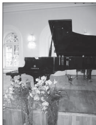
Vynikající interpreti hrají na festivalu na nástrojích špičkové kvality.