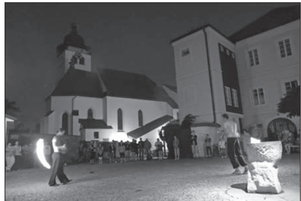
Text a foto: Jiří Hladík

Organizátoři připravili komentované prohlídky muzea doprovázené živou hudbou, ale i tematické občerstvení. Posílení nápojem lásky si návštěvníci vyslechli výklad o sběru magického kvítí a zvycích spojených s oslavou Svatojánské noci, v historickém sále pak zhlédli ukázkou dobových potřeb pro hospodyně a opodál si prohlédli nedávno otevřenou přírodovědnou expozici. Na závěr v potměšném Hildenském atriu vystoupila skupina Inferno s ohňovým show.