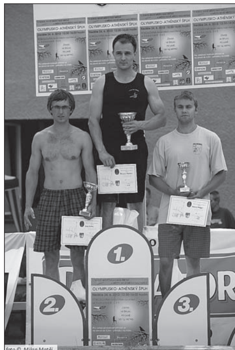
Stupně vítězů hlavní kategorie.

Připomeňme, že na Olympijských hrách v Athénách v roce 1896 zařadili organizátoři do sportovní gymnastiky šplh na laně bez přirazu nohou ze sedu na zemi do extrémní výšky 14 metrů. Vítěz, řecký námořník Nicolaos Andriakopoulos, dosáhl času 23,40 vteřiny!