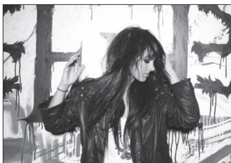
Piosenkarka Ewa Farna.

je novým produktem, určeným návštěvníkům Dusznik-Zdroju. Karta opravňuje po celou dobu pobytu k 10 % slevě v místech, která se stala partnery programu. CITY CARD obdrží každý návštěvník, který do našeho města přijede alespoň na 3 dny. Podrobnosti na www.karta.duszniki.pl .