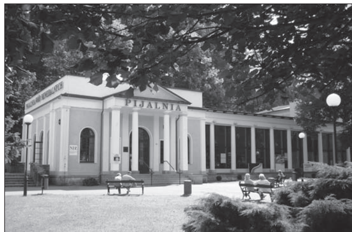
Pijalnia Wód Mineralnych.

www.sanatoria-dolnoslaskie.pl/index.php/pl/sanatorium-z , www.chemikduszniki.pl , www.zuk-sa.pl , www.resurs.com.pl , www.sloneczne-termy.pl .