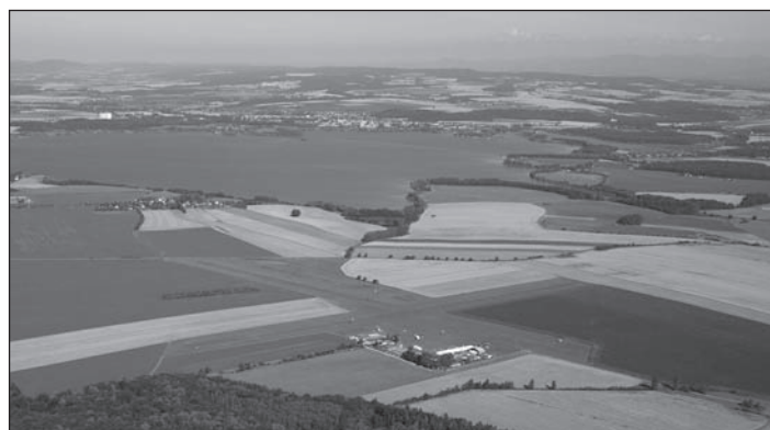
Vodní nádrž Rozkoš.

Trasa spacerowa zaprowadzi Państwa do punktów Juránka, Dvořáčka a Klosa, skąd rozciągają się przepiękne widoki na miasto i jego zabytki, warto również zobaczyć unikalny widok od strony rzeki Metuja na skalne podłożie, na którym zbudowane jest zabytkowe centrum. W niedalekim rezerwacie przyrody Peklo została w tym roku zbudowana trzymetrowa modrzewiowa dzwonniczka obok postaci wodníka i czartów. Dzieci natomiast mają okazję zobaczyć wolierę i zagrody ze zwierzętami w Klopotovském údolí.