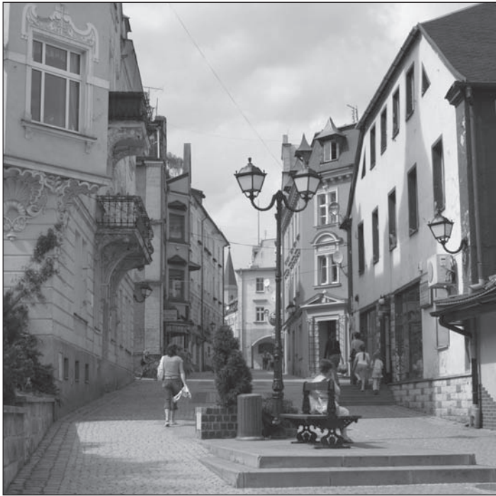
Spasaż spacerowy ul. Mickiewicza.