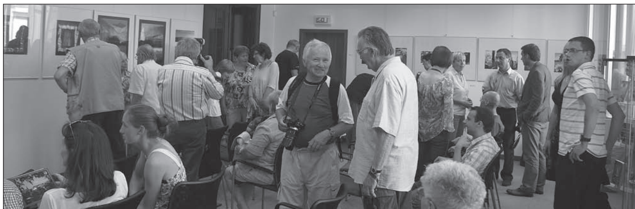
Vernisáž výstavy „Partnerské město“.

Życzymy powodzenia i z radością czekamy na wasze odpowiedzi!