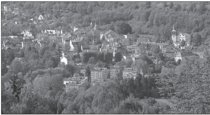
Widok na Duszynki-Zdrój.