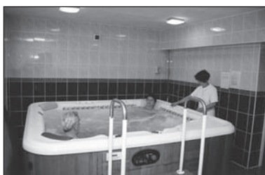
Zabieg hydromasazu. Vodoléčebná kúra.