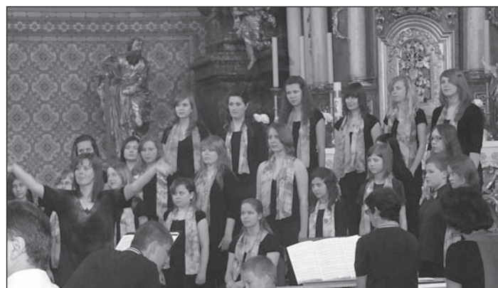
Występ chóru Paleček.

Podrobný program najdete také na oficiálních stránkách města Duszniki-Zdrój www.duszniki.pl .