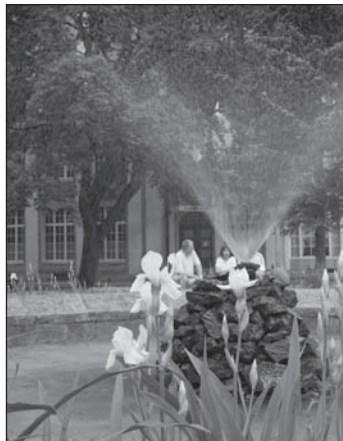
Fontanna w Parku Zdrojowym. Fontána v Lázeňském parku.