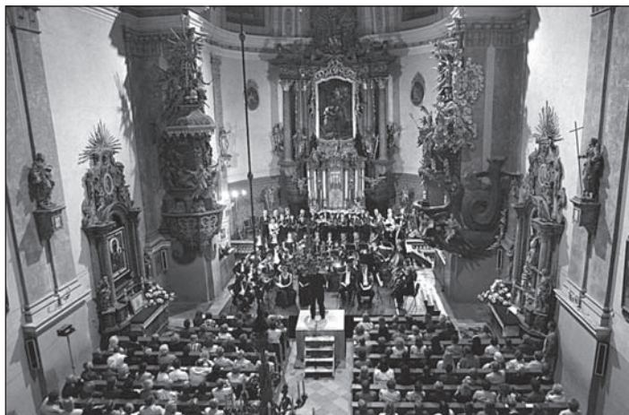
Koncert w Kościele św. Piotra i Pawła. Koncert w kościele sv. Petra a Pavla.

Więcej informacji na stronie www.chopin.festival.pl .