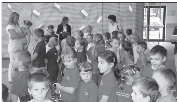
PL-CZ ekologiczna olimpiada.

Szczegółowy program znajdziecie Państwo również na oficjalnej stronie Miasta Duszniki-Zdrój www.duszniki.pl .