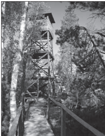
Torfowisko Pod Zieleńcem Rašeliniště pod Zieleńcem