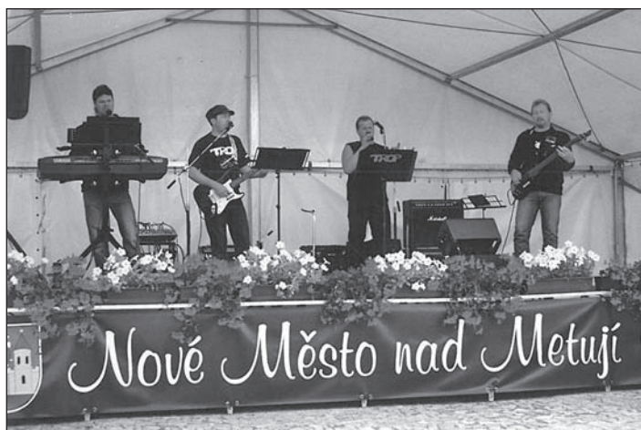
Hudební skupina TROP Olešnice v Orlických horách, 22. července 2012 vystoupěly na koncertě v Novém Městě nad Metují.

Promenádní koncert hudební skupiny TROP z Olešnice v Orlických horách proběhl v příjemné atmosféře na náměstí v Novém Městě nad Metují v neděli 22. července 2012 od 14.00 do 16.45 hodin s mnoha písničkami na přání navíc.