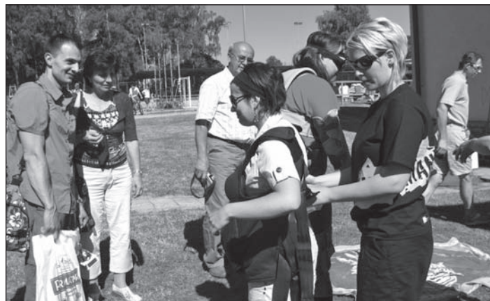
Návštěvníci akce Street (27. 6. 2010), kterou pořádal Klub Mandl, si mohli vyzkoušet simulátor těhotenství.