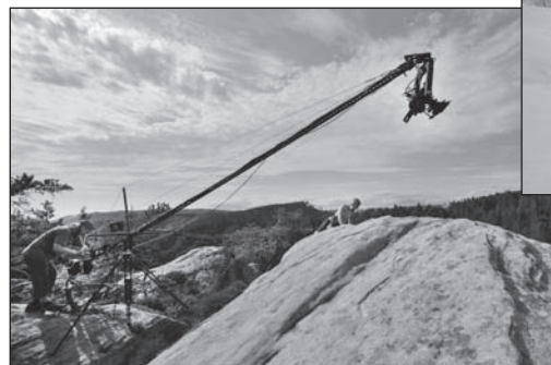
△ Točilo se v průběhu celého roku. Záběr z natáčení na Boru.