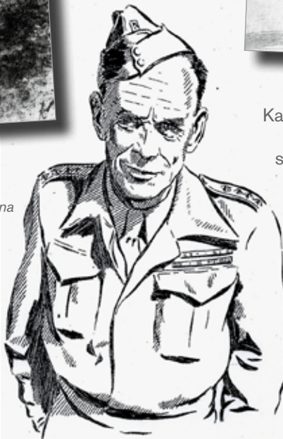
V období druhé světové války.