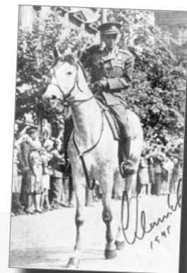
17. květen 1945. Karel Klapálek v čele 1. čs. armádního sboru vede v Praze pochod vojska na počest vítězství.