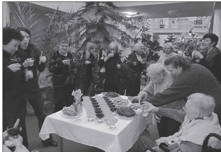
Záběry z vernisáže výstavy.