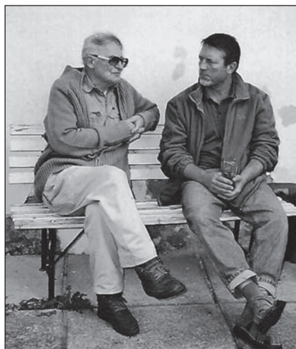
S mladým kolegou při diskuzi.