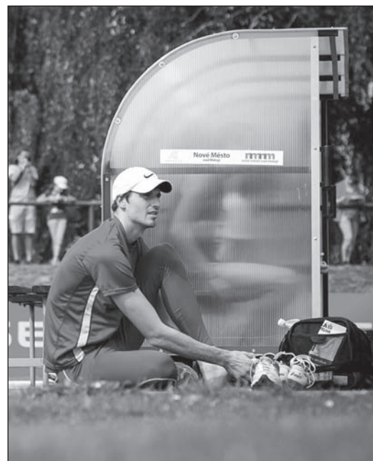
Česká výškařská legenda Jaroslav Bába.