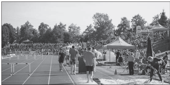
Na stadion si našlo cestu více než 1500 diváků.

Letošní atletická sezóna na našem stadionu byla vsutku ojedinělá. SK Nové Město nad Metují se pustil odvážně hned do tří projektů, které v konečném bilančování vyzněly jako velice úspěšné.