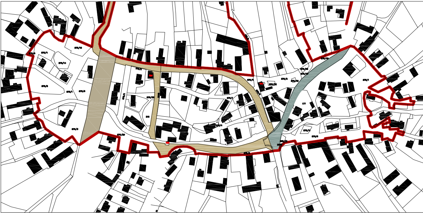
Náves: pozemky silnic a komunikací v majetku státu a kraje železniční dráha m 1 : 4 000