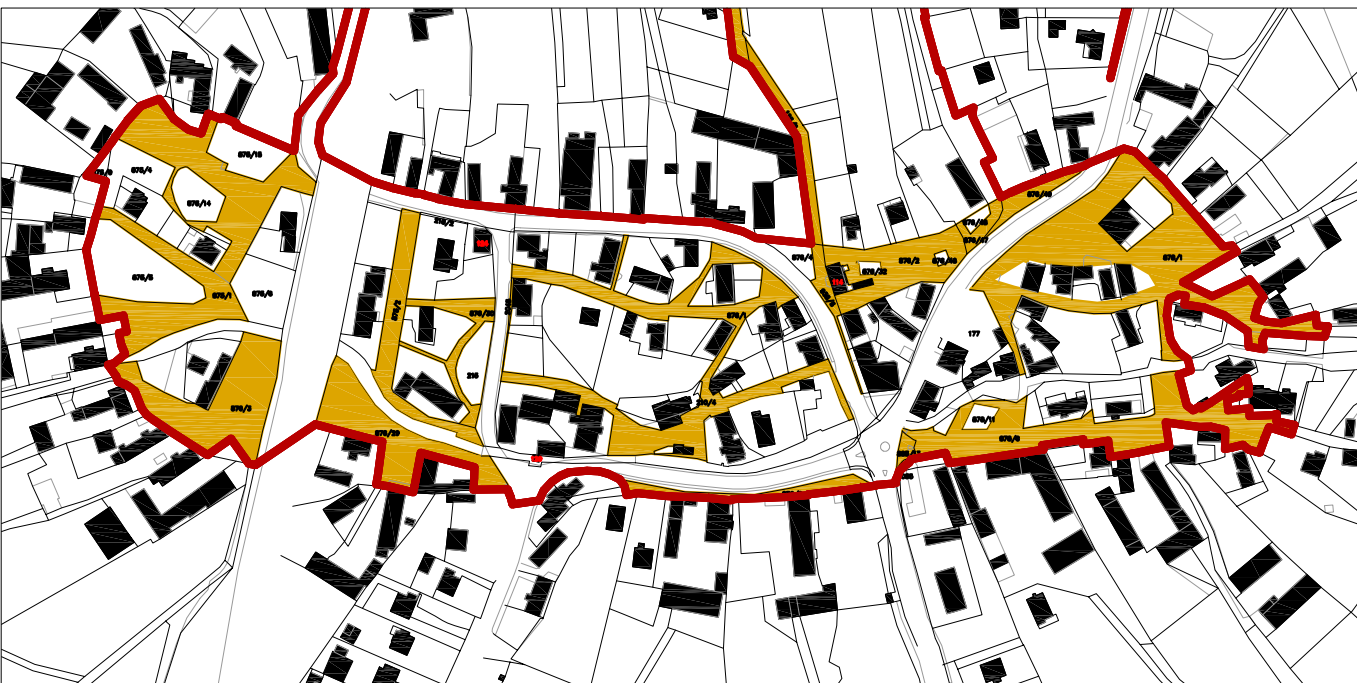
Náves: pozemky ostatních komunikací v majetku města Nového Města nad Metují m 1 : 4 000